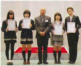
▲入選作品の中から作られた試作品 ◀代表して表彰を受けた入選者と佐藤会長（中央）

金太郎スイーツ甲子園は高校生を対象に金太郎や地元の農産物にちなんだスイーツやパッケージのアイデアを募集し、南足柄市の新しい名産物を産出することが目的。募集は昨年7月に地元の高校生に呼びかけて行われ、洋菓子部門32作品